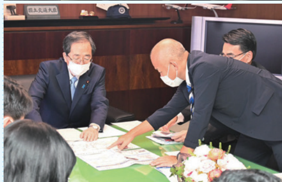
齊藤鉄夫 国土交通大臣