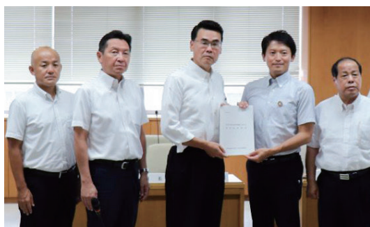
重要政策提言を斎藤知事に提出