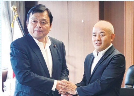
赤羽一嘉国土交通大臣に山陽東須磨駅のバリアフリー化の早期実現を要望する R1.9